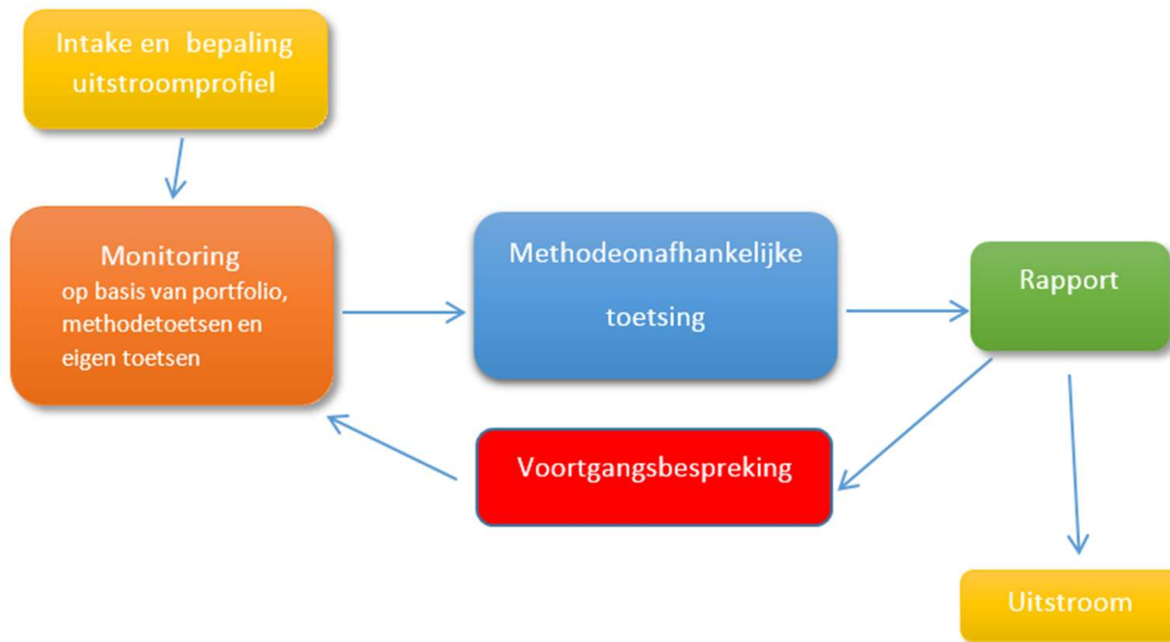
Afbeelding 2. Overzicht cyclus intake, toetsing, monitoring en uitstroom