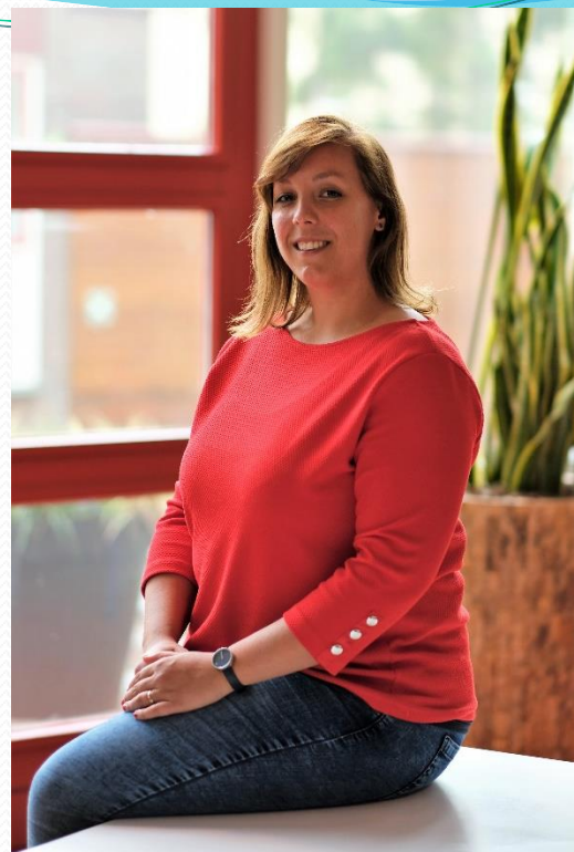
Lotte de Bruin Kenniscentrum SWPBS