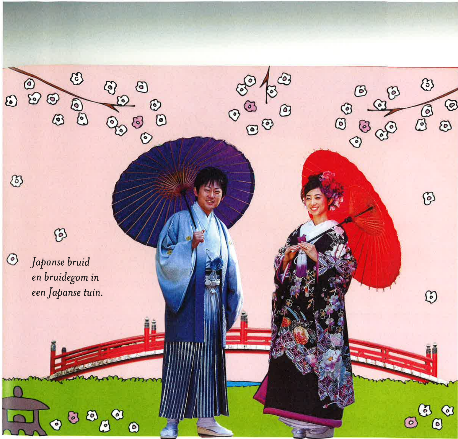
Japanse bruid en bruidegom in een Japanse tuin.