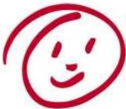
Sterke IB 'ers

Door een goede zorgcyclus zorgen we dat alle leerlingen een passend aanbod krijgen. Welke toetsen zet je in? Toets je om de 10 of 13 weken? Waar noteer je de toetsgegevens? Hoe analyseer je en waar let je op? Welke doelen stel je voor de leerlingen? Wanneer stel je de doelen wel/niet bij? Hoe maak je een jaarlijkse analyse? En doe je dat op groepsniveau/ leerlijn / vakgebied?