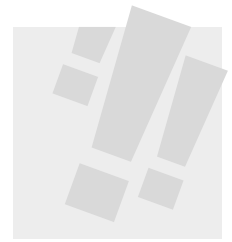
Invoering zogenoemde 'koppelingwet'