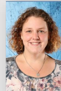
Maaïke Tukker Techniek