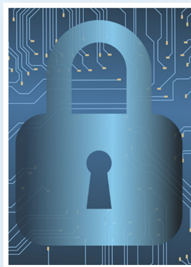
inloggen met je wachtwoord

Op veel websites moet je inloggen. Je verzint dan een naam. En een wachtwoord. Een wachtwoord moet geheim blijven. Je mag het tegen niemand zeggen. Hoe ziet een wachtwoord eruit? Een wachtwoord bestaat uit karakters. Karakters zijn letters, cijfers en andere tekens. Zoals de p, 8 en !. Sommige mensen proberen je wachtwoord te raden. Dat heet kraken. In de tabel zie je hoelang het kraken duurt. Hoe ziet jouw wachtwoord eruit?