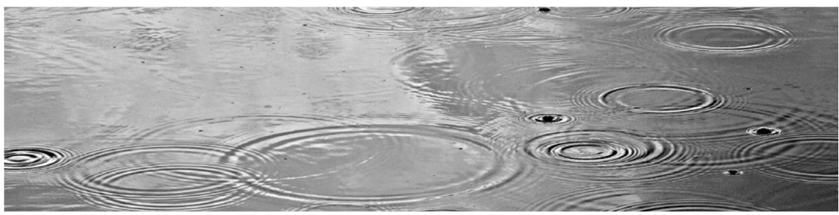
de druppels in de plas

de tabel = een schema met getallen, je kunt er gegevens uit halen