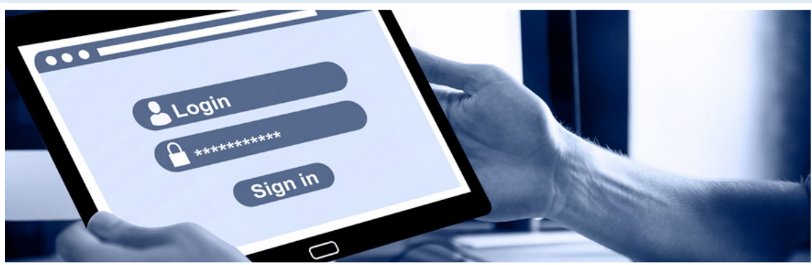
inloggen met je wachtwoord

mogelijke [spreek uit: moo - guh - luh - kuh]