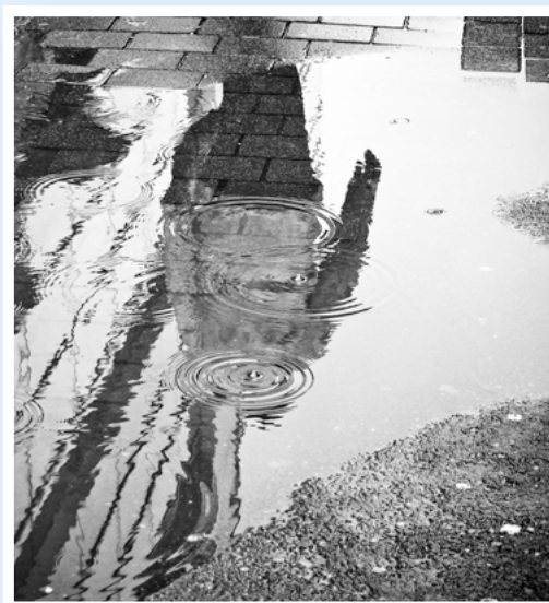
veel water in een plas